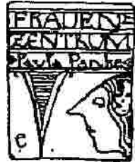
Frauenzentrum Paula Panke e.V.

Was für Frauen grundsätzlich wichtig ist: 6 Punkte für den Umgang mit dem Thema Brustkrebs in Deutschland